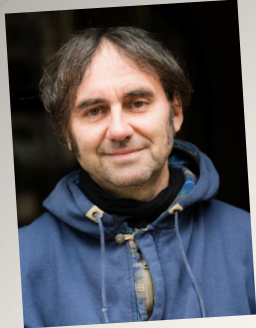
Der Autor 2017