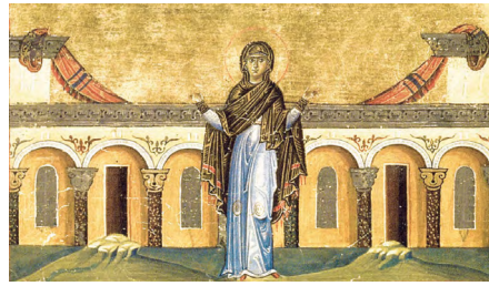
Die Wüstenmutter Syncretica von Alexandria (ca. 270–350), dargestellt in einer Byzantinischen Handschrift aus dem 11. Jahrhundert

14.30 Weisheit zwischen Himmel und Erde: theologische Impulse für ein gelingendes Leben und einige Zwischenrufe.